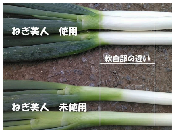
本発明 導入・未導入のネギ品質の比較